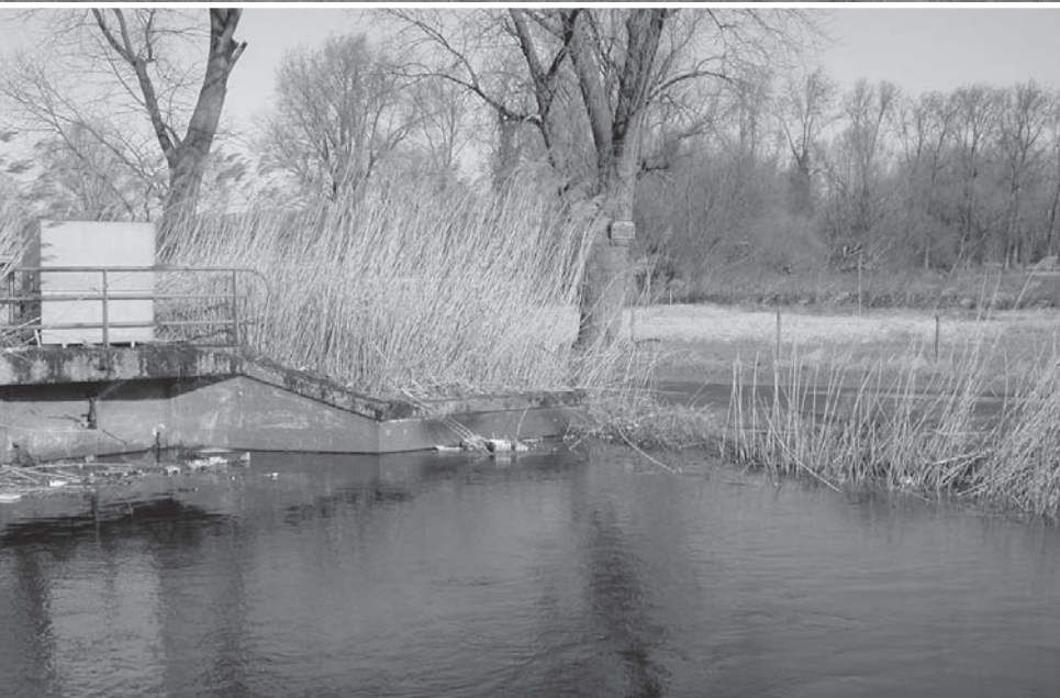
De rioolwaterzuiveringsinstallatie Ossemeersen met van boven naar onder: het beluchtingsbekken, een bezinkingsbekken en de effluentgracht (die regelmatig dreigt over te lopen in het reservaat)