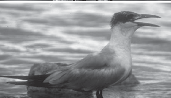
Van boven naar onder: pijlstaart, kraanvogels (foto Geert Spanoghe), kanoetstrandloper, zwarte stern en reuzensterne (foto Geert Spanoghe)

Het beest heeft daar immers twintig kilometer sloten en grachten met hoge oeverbegroeiing waarin hij zich kan verstoppen.