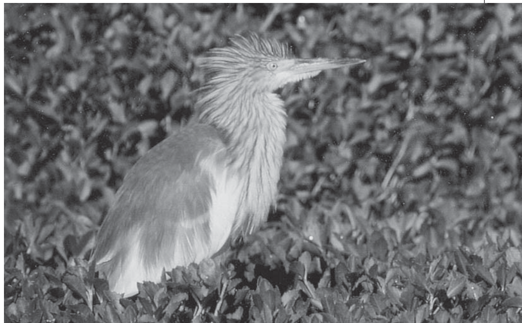
Ralreiger: héél zeldzaam in België

Tussen 10 en 17 maart pleisterden in Doornzele één tot twee kleine zilvreigers . Op 23 maart werd er ook één in de Bourgoyen gezien, op 22 mei kortstondig twee exemplaren. Vanaf half april verbleven er na een korte onderbreking (met slechts één exemplaar) bijna voortdurend twee exemplaren op Doornzele, in mei slechts één exemplaar, tot de 8 ste . Op 25 april zat er één in de Gentbrugse meersen nabij Heusden-brug. Vermoedelijk dezelfde vogel werd op 28 april te Destelbergen gezien. Op 29 maart kwam er op de dijk van de grote plas te Doornzele een grote zilvreiger slapen. Op 21 april werd er opnieuw één waargenomen, dit keer een gekleurigd exemplaar. Het is nog niet bekend of deze vogel