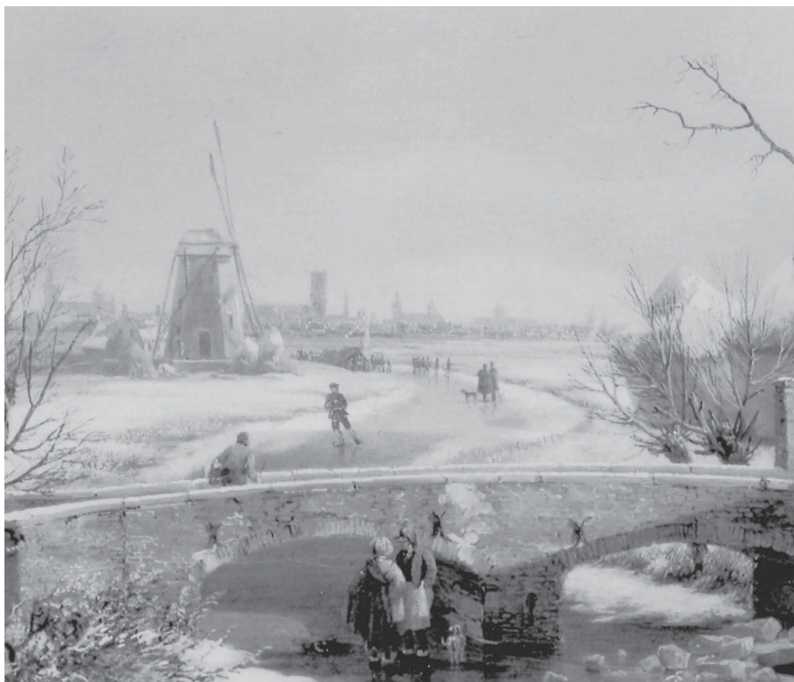
De hoosmolen aan de Leie te Drogen. Fragment van een schilderij door P.F. de Noter (1831). De enige gekende afbeelding van de molen met wieken.