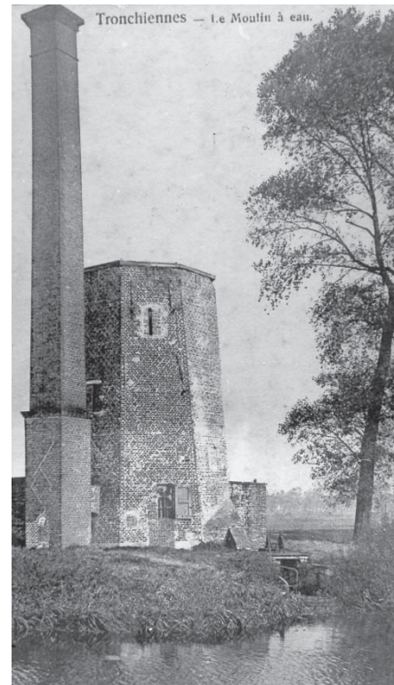
De afgeknotte molenromp met de bakstenen schoorsteen uit het midden van de 19e eeuw

In 1997 startte de Stad Gent een restauratieprogramma dat in 2005 werd afgerond. De site werd archeologisch onderzocht en het metselwerk werd grondig hersteld. De basis van de vroegere schoorsteen werd blootgelegd. Via een wenteltrap is de molen opnieuw toegankelijk tot boven. De pomp uit 1897, die al ruim twintig jaar stil lag, kan opnieuw water hozen. Uiteraard gebeurt dit nu enkel bij wijze van demonstratie. In de molenromp bevinden zich infopanelen over de geschiedenis, techniek en restauratie van de Hoosmolen.