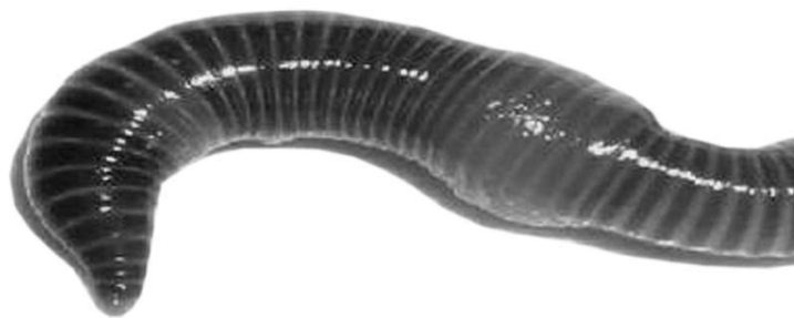
Wiero, de rode worm

Maar omdat elk kasteel een koning nodig heeft, besloten de bewoners dat ze een verkiezing zouden houden. Deze koning zou niet verkozen worden omdat hij dapper, knap of sterk was. Nee, deze koning zou gekozen worden omdat hij veel sappige geluiden kon maken en veel wormenhoopjes kon produceren. Toen de verkiezing begon, ging iedereen zitten. Iedereen mompelde, momperde en knauwde toen de kandidaten op het podium verschenen.