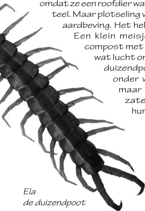
Ela de duizendpoot