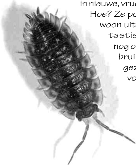
Sam de pissebed

Hoe? Ze poepten het gewoon uit! Het was fantastische kaka, die nog opnieuw kon gebruikt worden als gezonde voeding voor planten.