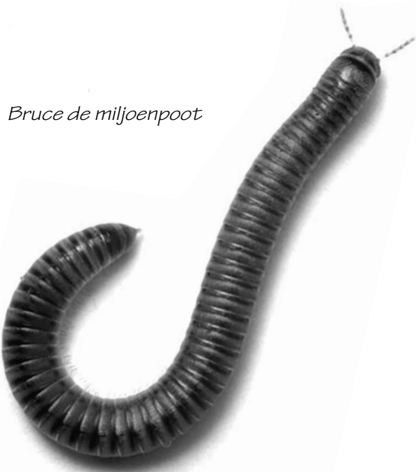
Bruce de miljoenpoot