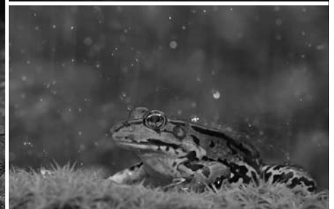
Alpenwatersalamander (boven) - groene kikker (onder)