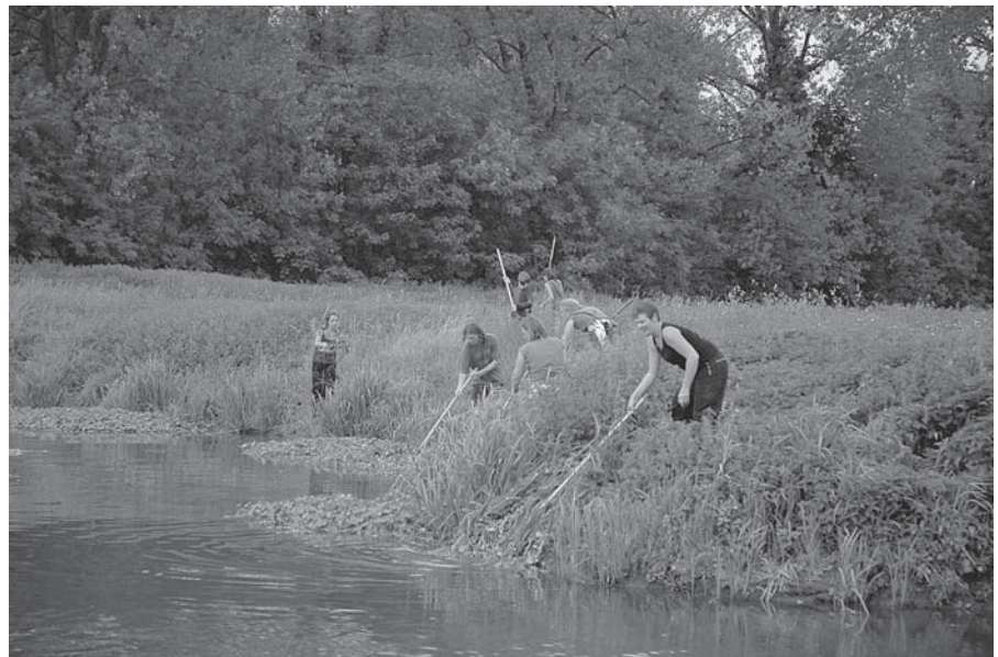
Vrijwilligers aan het werk: amper twee maanden na het verwijderen van de grote water- navel waren al dikke tapijten teruggegroeid. Een werkje van lange adem...

Om optimaal van de natuur in de Assels te kunnen genieten, plannen we nog de plaatsing van een kijkhut met knuppelpad in het bosje aan de linkerkant van de ingang van het reservaat. Van hieruit zou je een goed uitzicht moeten hebben op de Boterput, die er door de werkzaamheden veel mooier uitziet, en de achterliggende meersen. Laat de vogels maar komen! Het gebied zal op langere termijn ook kunnen worden bezocht via twee nieuwe wandelverbindingen die de VLM samen met de Stad Gent zal realiseren in het kader van het inrichtingsplan. Wordt dus vervolgd... 📍