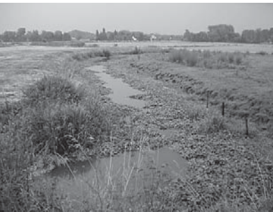
Zicht op de met grote water- navel overwoekerde Oude Leie vanop de Leiedijk

in ons bijna twaalf hectaren groot natuurgebied in de Assels was er zeer veel verkeer. En dan nog wel van grote, kleurrijke machines en kranen op rupsbanden en ballonbanden. Wat die daar uitgevoerd hebben? Hieronder geven we een overzichtje van de werkzaamheden en lees je hoe ze de biotoop van de meersen verbeterden, zowel voor de natuur als voor de mensen die er van komen genieten.