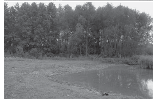
Voor, tijdens en na: een moeraszone wordt gecreëerd aan de Boterput.

de Afdeling Wegen en Verkeer Oost-Vlaanderen en de afdeling Boven-schelde van het Vlaams Gewest, de NMBS en vzw Natuurpunt. De coördinatie en delen van de uitvoering van het project gebeuren door de Vlaamse Landmaatschappij (VLM). De inrichtingswerken in de Assels werden ontworpen en opgevolgd door de VLM in samenspraak met