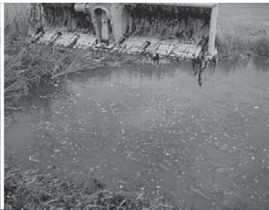
De terreinploeg aan het werk met kraan en bootje