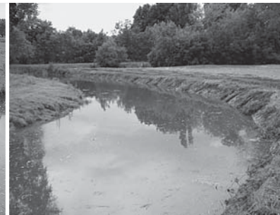
Het resultaat van de inspanningen