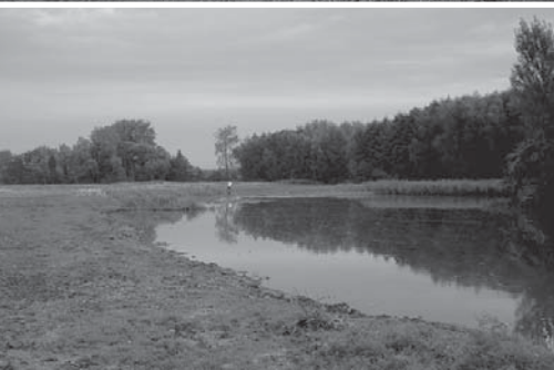
Voor, tijdens en na: de opgehoogde oevers van de Boterput worden in hun oorspronkelijke staat hersteld.

Natuurpunt. De kosten worden voor 80% gedragen door de Vlaamse Gemeenschap, de overige 20% (een slordige 15.000 euro) neemt Natuurpunt Gent voor haar rekening.