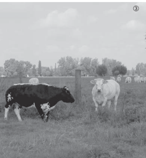
Foto 1 en 2: Juni: de eerste maaibeurt sinds vele jaren Foto 3: Juli: deze medewerkers zorgen voor de nabegrazing. Foto 4 en 5: Augustus: ook talrijke vrijwilligers leveren hun bijdrage. Foto 6: Ruigte: zoek de bosrietzanger!

Voor wie het gebiedje op een nóg rustiger manier wil leren kennen kan gewoon deelnemen aan één van onze geleide wandelingen. Onze traditionele Asselswandelingen worden uitgebreid met een bezoek aan het natuurreservaat 'de Assels'! Eerstkomende geleide wandelingen: zondag 12 oktober en zondag 14 december . Afspraak telkens om 14 uur op Drongenplein. Vooral voor het terreinbezoek kunnen laarzen noodzakelijk zijn.